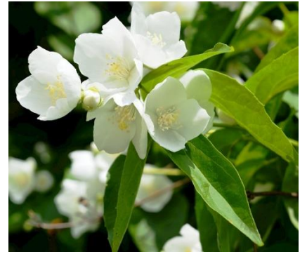
Deutzia scabra ,