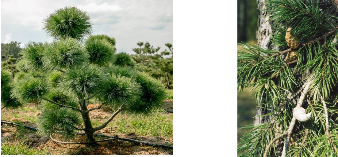
Рис. 2. Сосна веймутова (ліворуч) та сосна Банкса (праворуч).

парках і сосну Банкса, яка родом теж з Північної Америки, де росте на схилах Скелястих гір, а в Україні є окрасою парків завдяки своїй оригінальності (рис. 2.).