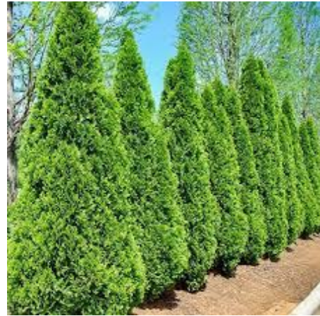
Рис. 7. Кедр ліванський (ліворуч), туя західна (праворуч).

Перші тисові дерева з'явилися на планеті 200 мільйонів років тому. За міцністю деревина тису може порівнятися з залізом. Гуцули з гілок та трісок тису вистругували цвяхи. З тису робили найцінніші меблі, лемеші, лопати, фанеру, фундаменти водяних млинів, мостів, греблі, руків'я кинджалів та мечів, луки, стріли, списи. Недоліком тису є його дуже повільний ріст. Товщина річних кілець не більше одного сантиметра.