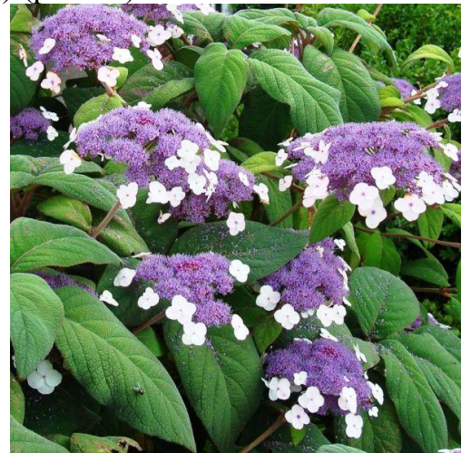
Рис. 2. Зліва-направо: Hydrangea paniculata Siebold 'Vanilla Fraise', Hydrangea quercifolia W.Bartram 'Black Porch', Hydrangea sargentiana Rehder).