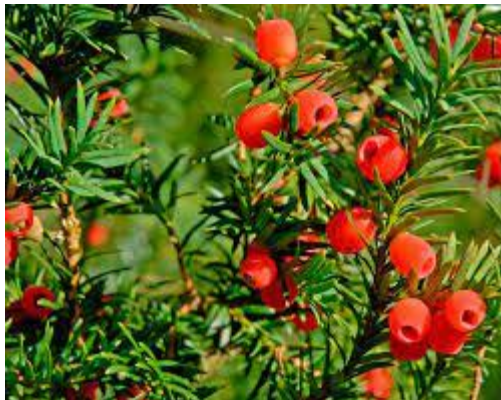
Рис. 8. Тис ягідний.

уражує нервову систему та органи травлення. Правильно приготовлений настій хвої тису народна медицина використовує для лікування хвороб серця та проти укусу гадюк.