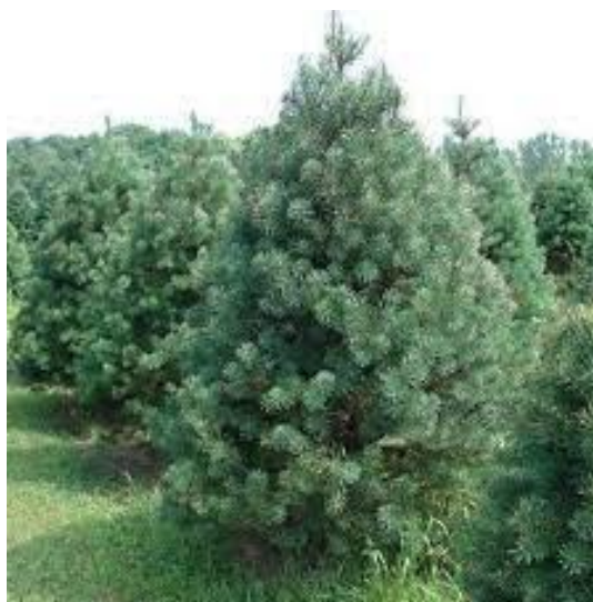
Рис. 1. Сосна звичайна.

Соснова хвоя містить особливо багато вітаміну С. Цікаво, що кількість його збільшується з пониженням температури повітря.