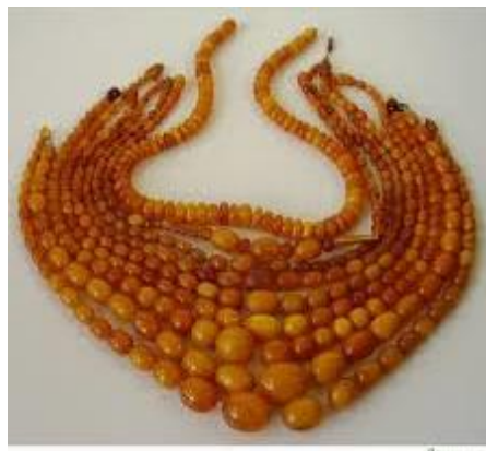
Рис. 4. Янтар та вироби з нього.