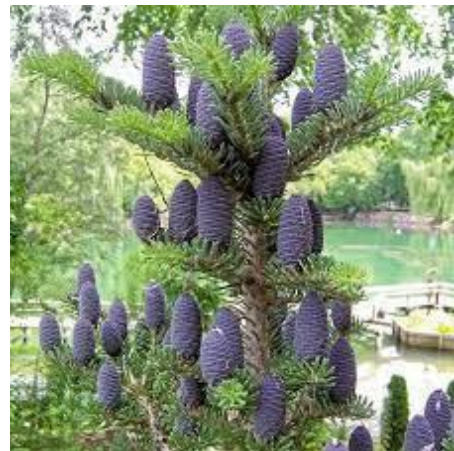
Рис. 6. Яловець козачий (ліворуч) та ялиця корейська (праворуч).