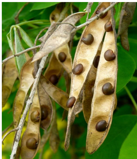
Рис. 2. Суцвіття Laburnum anagyroides та плоди.

Рослина росте швидко, початок віку плодоношення – трирічний. Надає перевагу кальційним ґрунтам, але витримує і слабокислі родючі суглинки, може рости та на кислих ґрунтах. Вибагливий до вологості, але може переносити й короткотривалу посуху. Морозостійкий, димо- та пило стійкий.