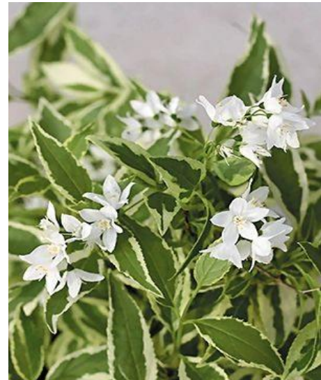
Рис. 3. Форми Deutzia gracilis 'Aurea' (ліворуч) та 'Variegata' (праворуч).

Заготівлю живці гортензії здійснюють у період квітання, зрізують апікальні (верхівкові) пагони поточного року. Перед висаджуванням у теплицях готують склад ґрунтосуміші у співвідношенні перегною, ґрунту та торфу і піску 2:2:1:1, іноді торф, пісок у співвідношенні 3:1, або ж використовують перліт.