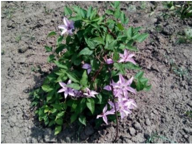
Clematis × jackmanii